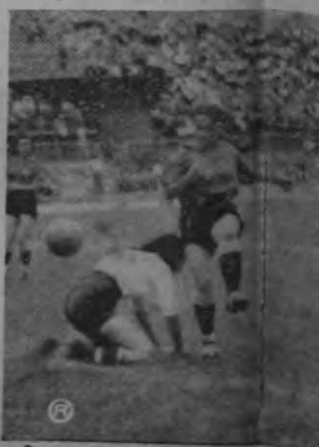
El tercer tanto de las locales Marta G...