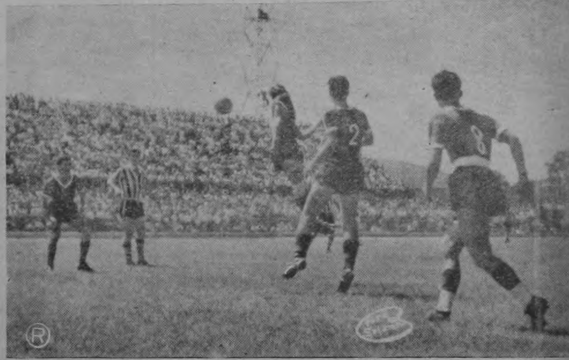
Entrevero en la valla de Alvarado en el partido Alajuela-Libertad del Paraguay.

El partido fue más emocionante en el segundo tiempo, y finalizó con el triunfo de las locales por 2 goals a 1.