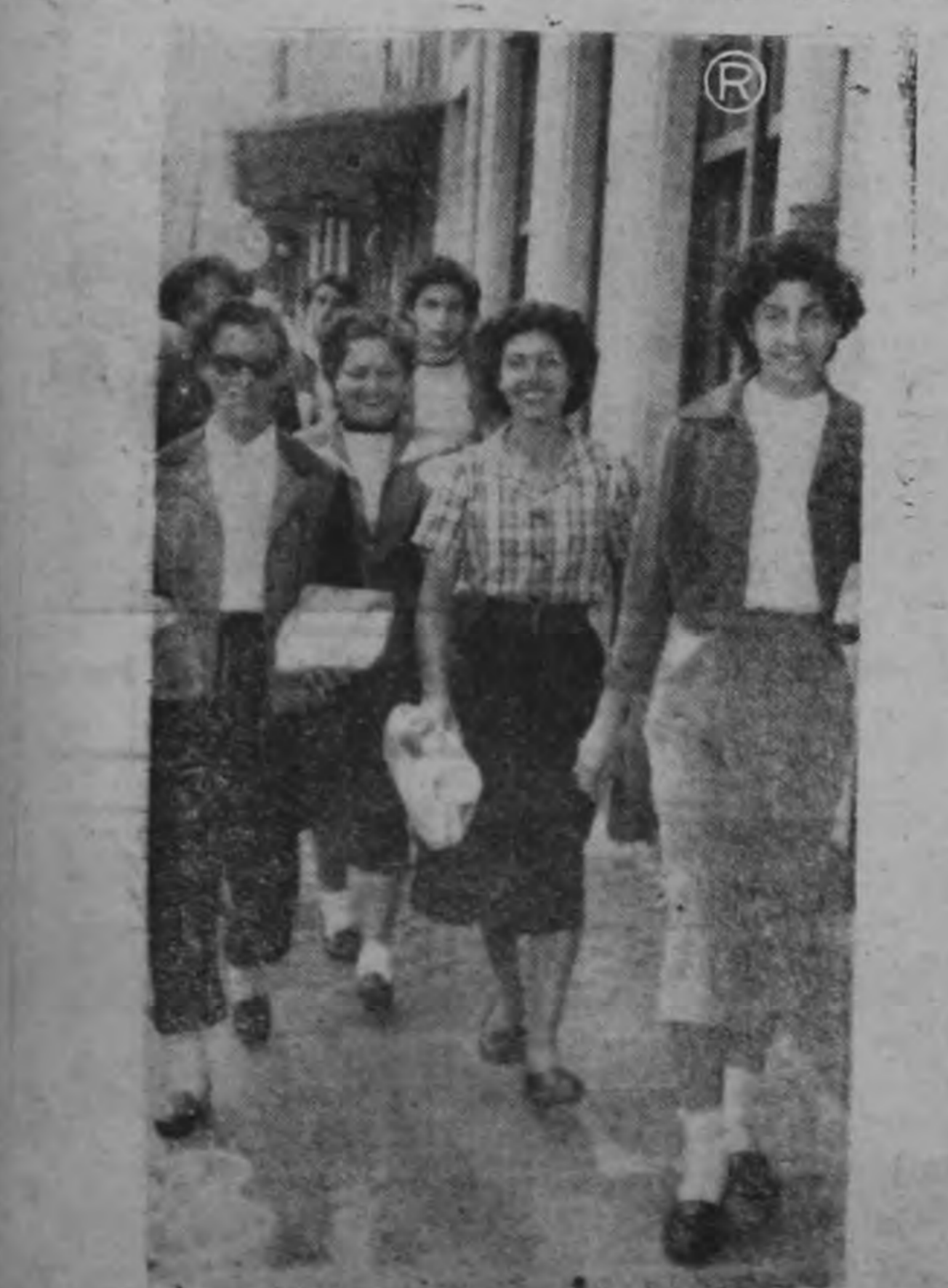
futbolistas cubana y ticas andan de compra, por las calles de San José.