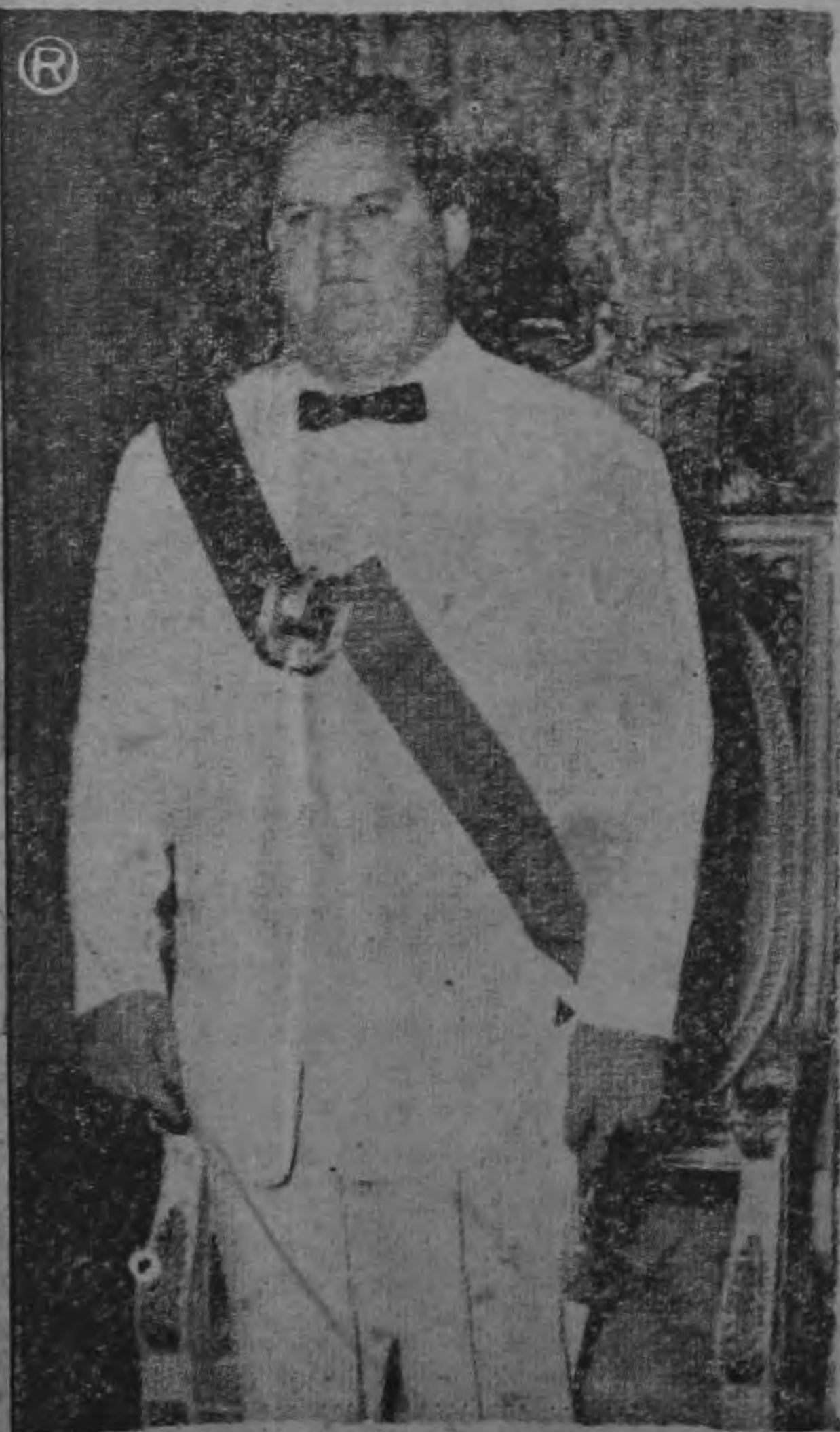
PRESIDENTE JOSE ANTONIO REMON Una de las últimas fotografías del Presidente de Panamá José Antonio Remón, asesinado antier en un atentado perpetrado por toda América.