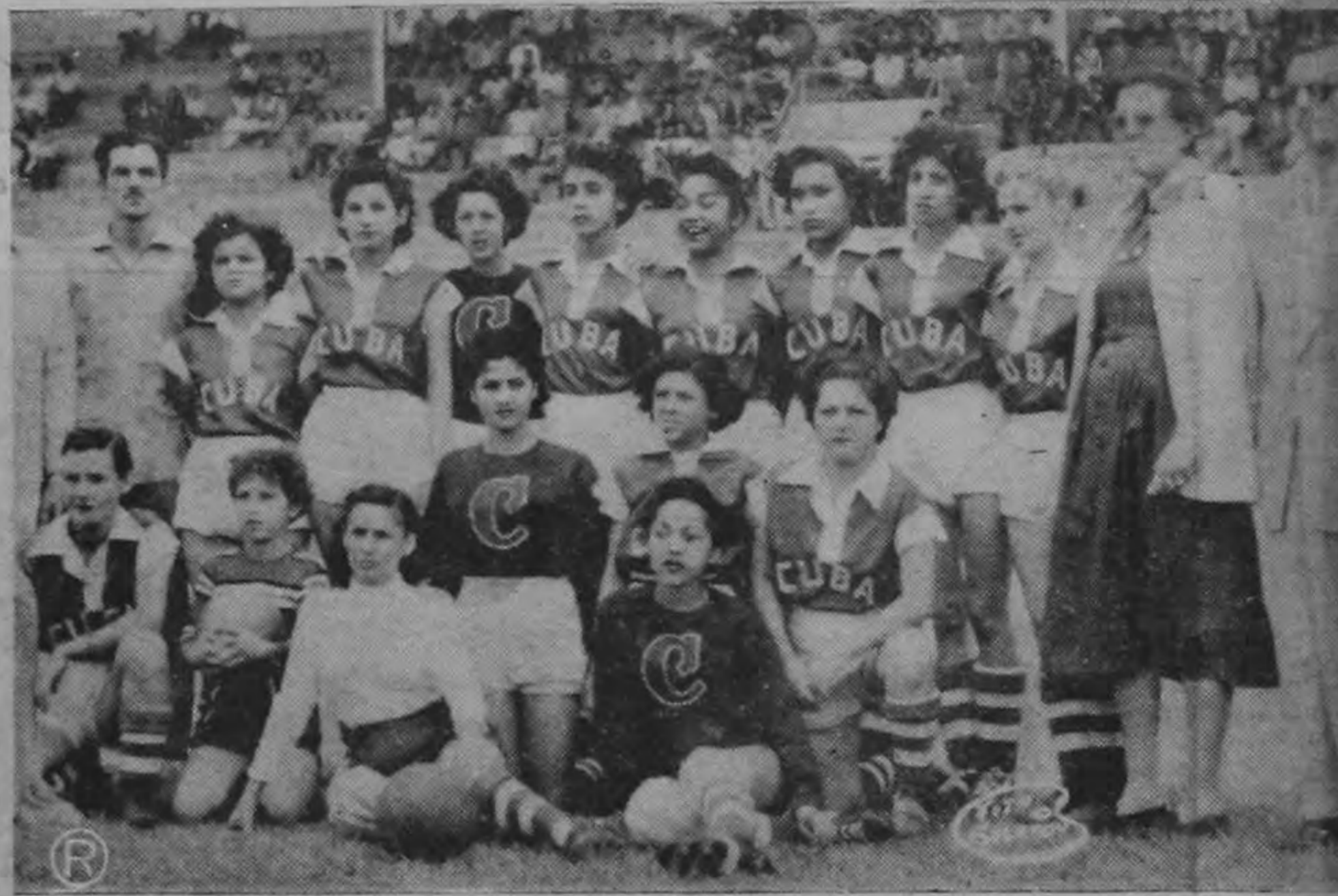
La delegación cubana que participó en la serie internacional de futbol femenino con la de Costa Rica.