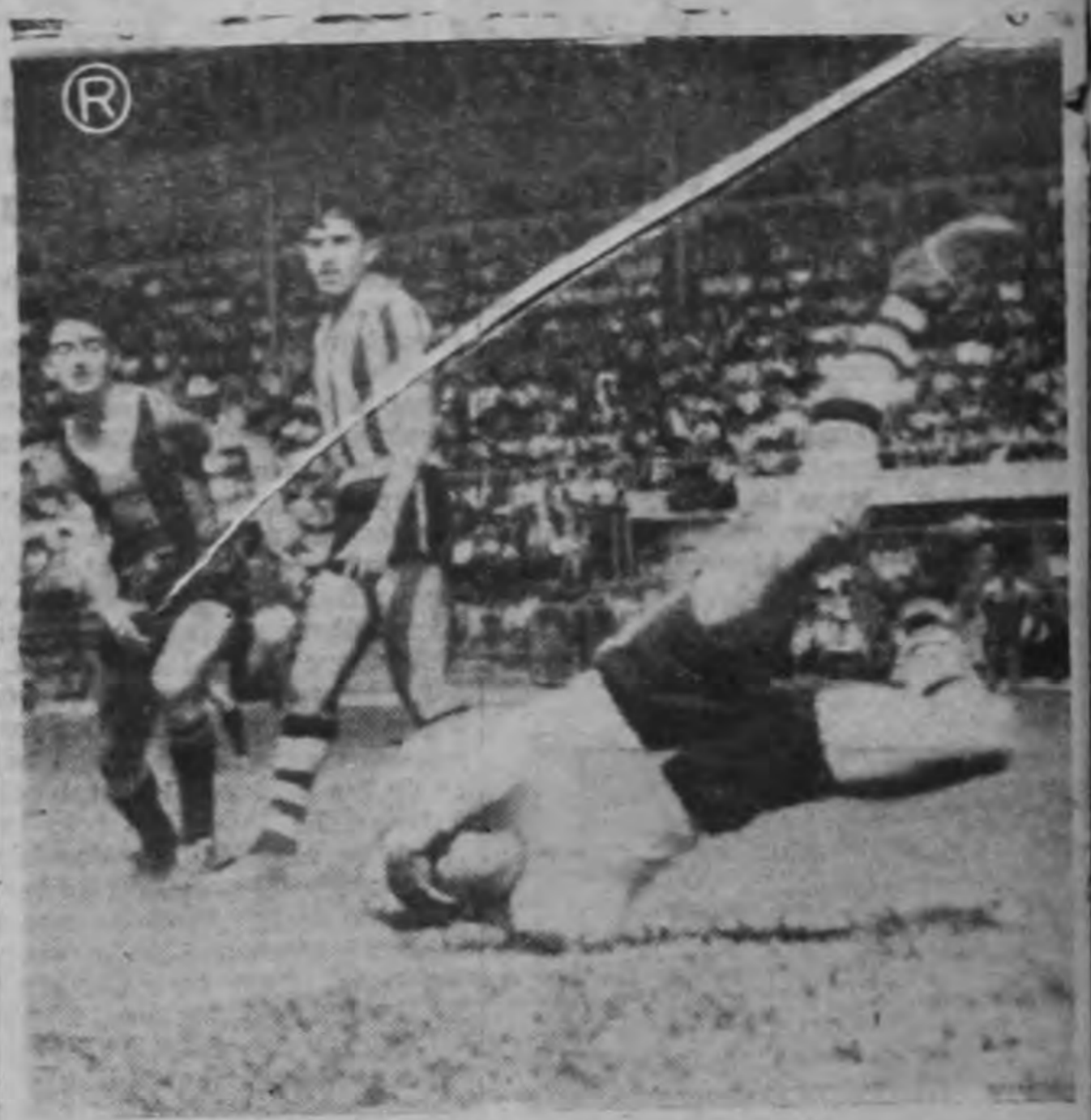
El arquero paraguayo Vargas en una estirada a fondo.

El segundo goal de los visitantes fue inatajable, por lo que no caben responsabilidades al arquero. Y ese goal se produjo en circunstancia que hacía rato dominaba al equipo local. Así es el fútbol, pero también cabe recalcar el hecho de la falta de remate a que tantas veces nos hemos referido, aconsejando el tiro al