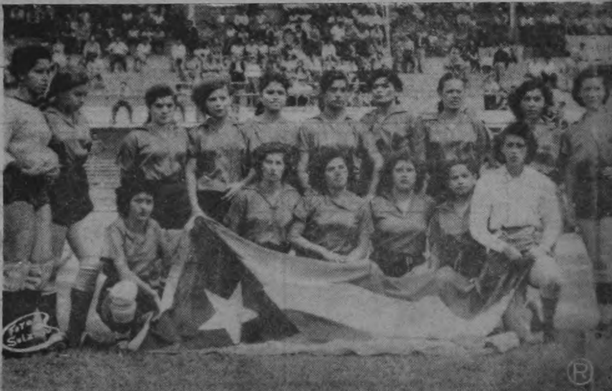
Jugadoras costarricenses que ganaron la serie internacional de futbol femenino a la selección de Cuba.