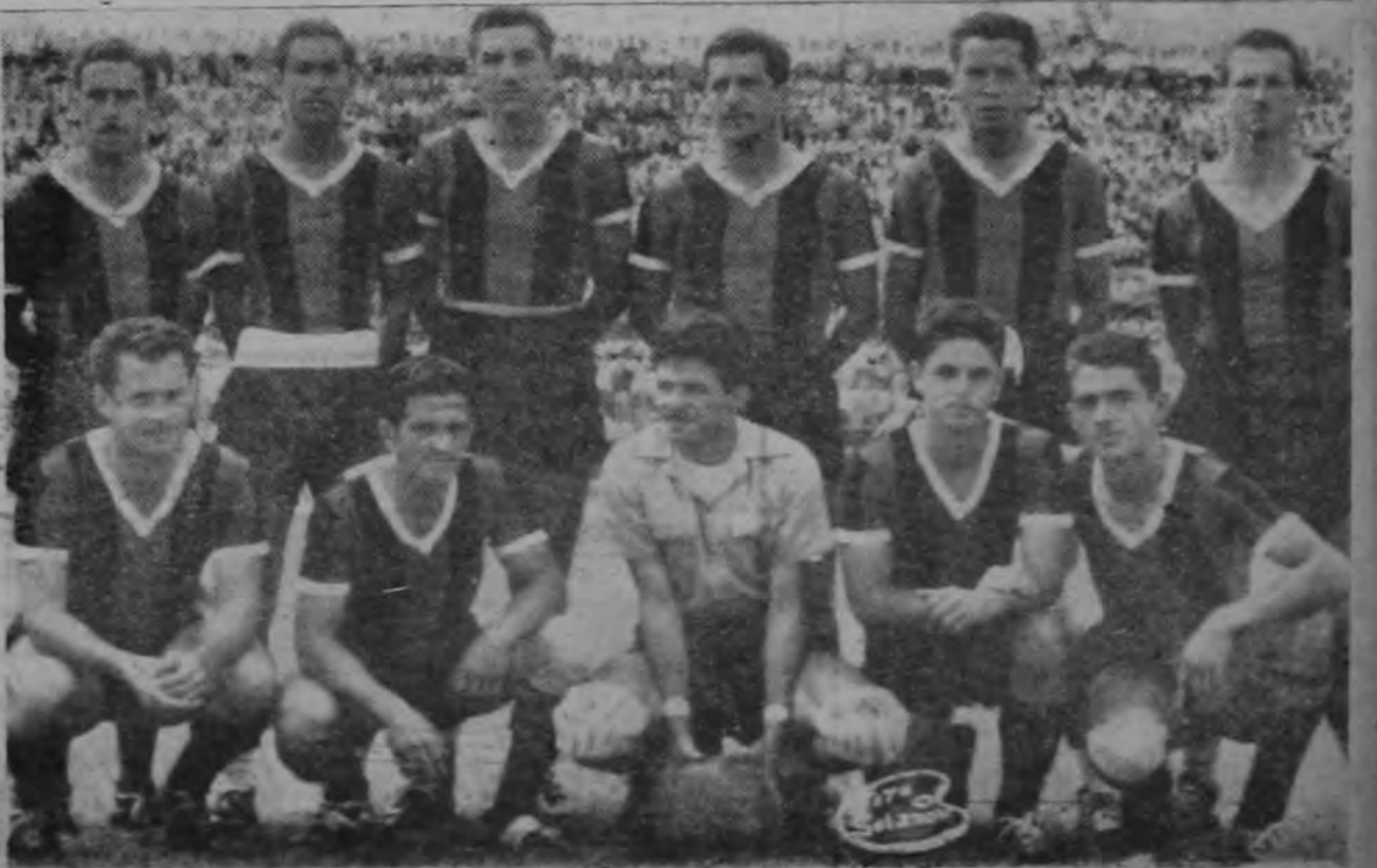
Jugadores que integraron el equipo Alajuelense, que jugando de igual a igual, perdió frente a Libertad del Paraguay por dos goles a uno.