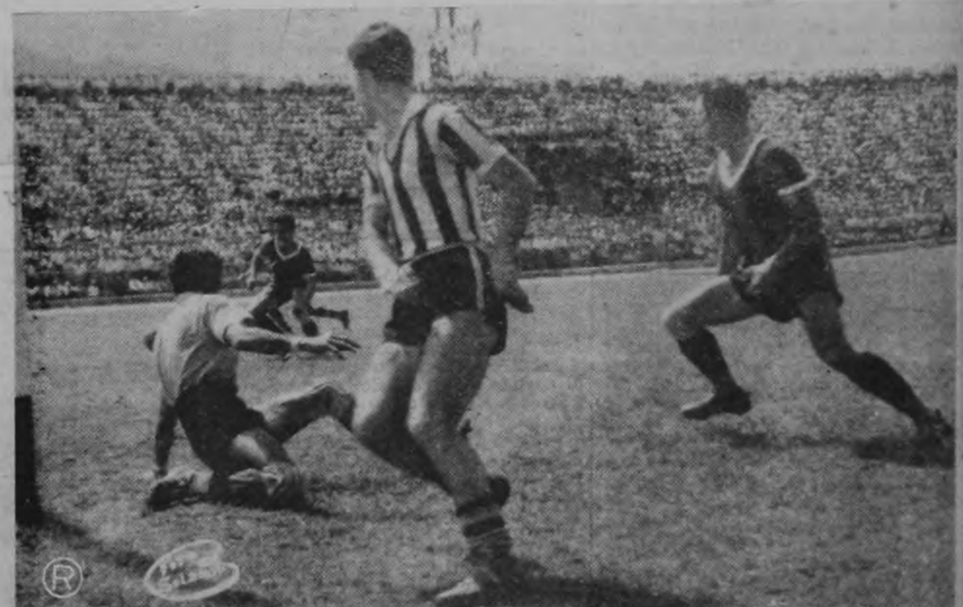
Momento en que se produjo el segundo gol de los paraguayos.