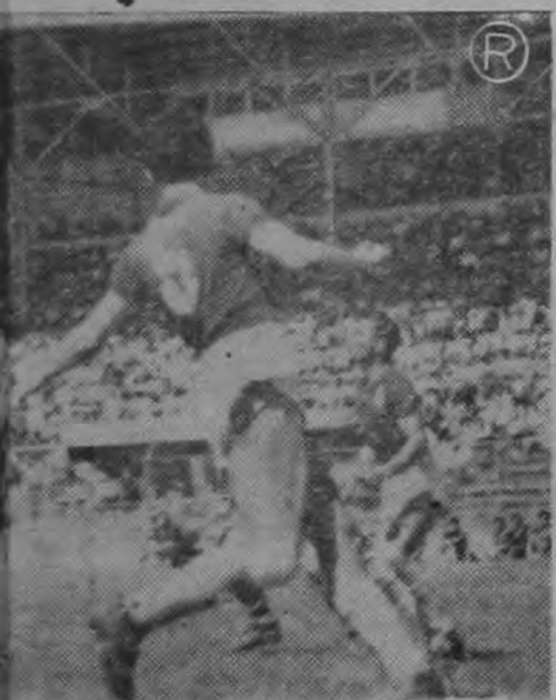
Una atajada espectacular.

Interesante resultó la serie internacional de fútbol femenino que jugaron los equipos de Costa Rica y la Selección de Cuba. El fútbol femenino, como ya lo dijimos en el comentario sobre el partido del debut de las cubanas es atractivo como deporte y por su novedad.