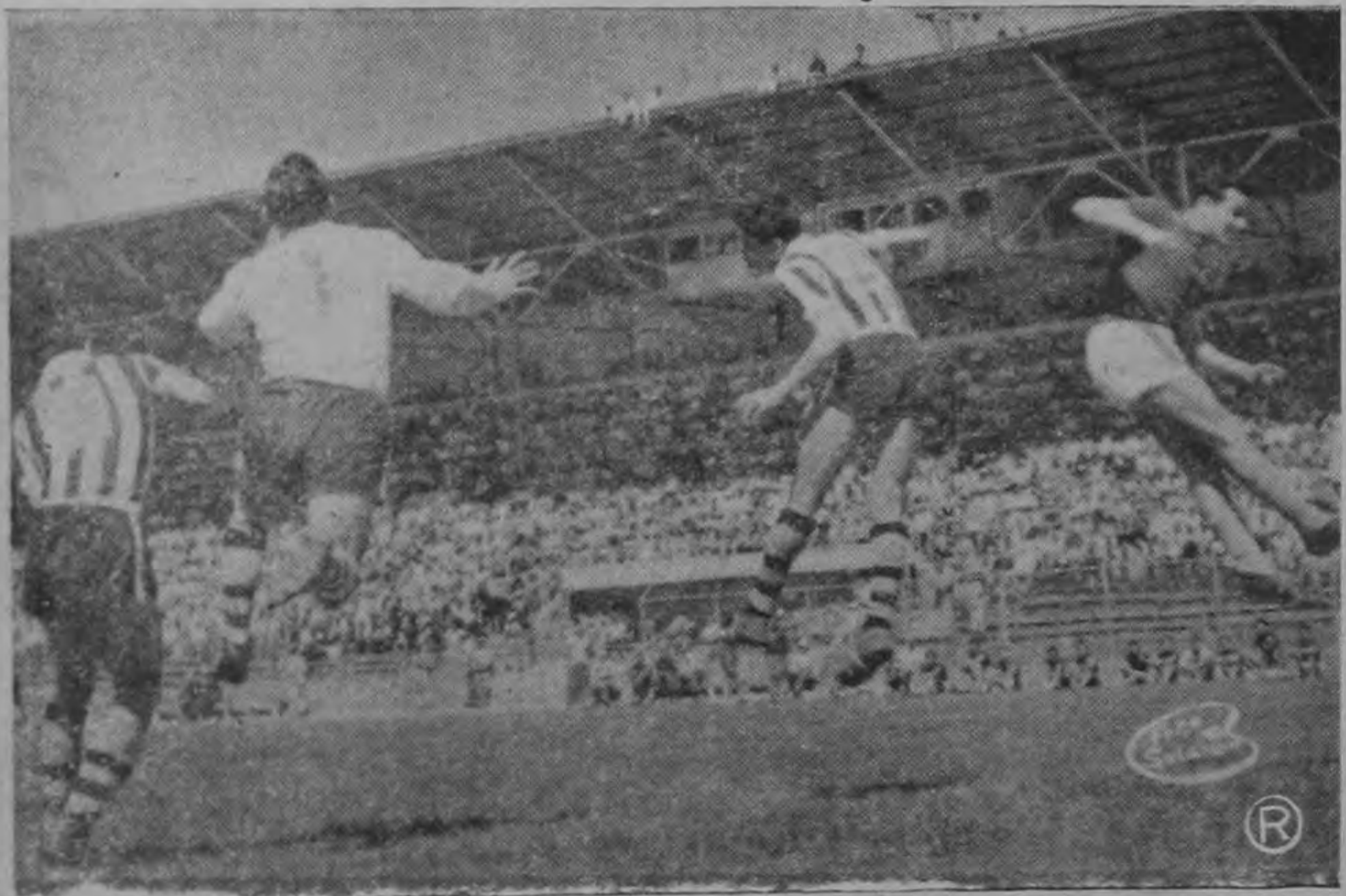
Momento álgido para la defensa de Libertad del Paraguay en que todos saltan para cabecear la pelota.